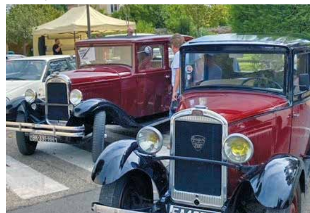
RASSEMBLEMENT DE VÉHICULES ANCIENS LE 22 SEPT.