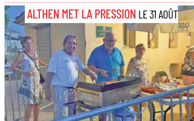
ALTHEN MET LA PRESSION LE 31 AOÛT