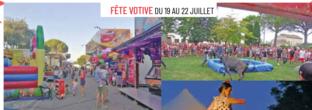
FÊTE VOTIVE DU 19 AU 22 JUILLET