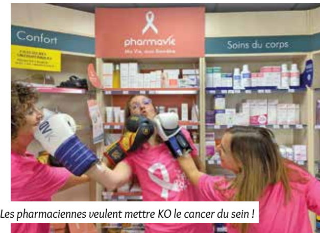
Les pharmaciennes veulent mettre KO le cancer du sein !

P our le mois de sensibilisation du Cancer du sein, Octobre Rose, la pharmacie La Garance souhaite soutenir une association de lutte contre le cancer : les Roses Poudrées. C'est une association qui propose aux personnes atteintes de cancer des soins de support individuel à domicile, des ateliers de soins collectifs et des journées d'évasion pour leur bien-être. Ces soins permettent à ces personnes de se sentir mieux, vivre un moment de confort. Ces quelques minutes de bien-être leurs redonnent de l'énergie pour remonter sur le ring et affronter l'adversaire dans leur quotidien. Le combat est long, et, on sait que le bien-être tant moral que physique est important pour riposter face à la maladie.