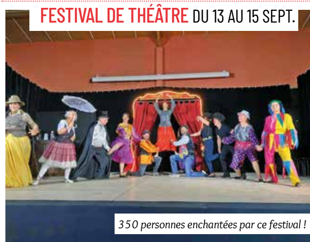
350 personnes enchantées par ce festival !