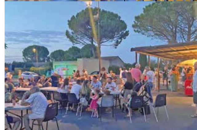
FESTIVAL DE THÉÂTRE DU 13 AU 15 SEPT.