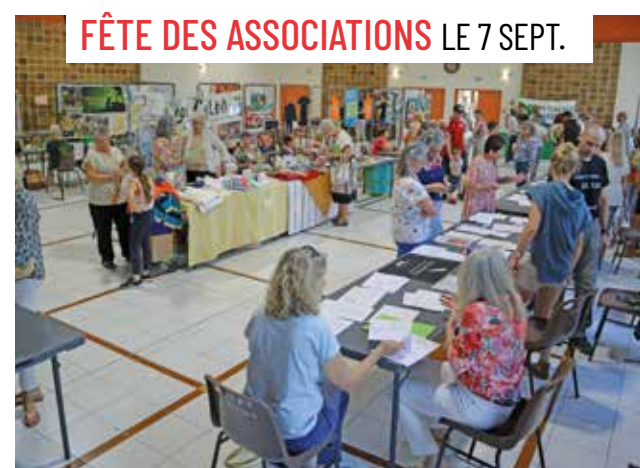
FÊTE DES ASSOCIATIONS LE 7 SEPT.