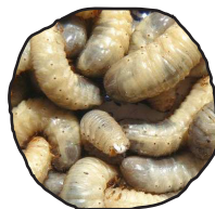
Larves de cétoine dorée