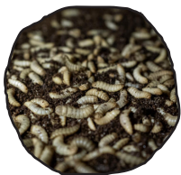
Larves de mouche soldat