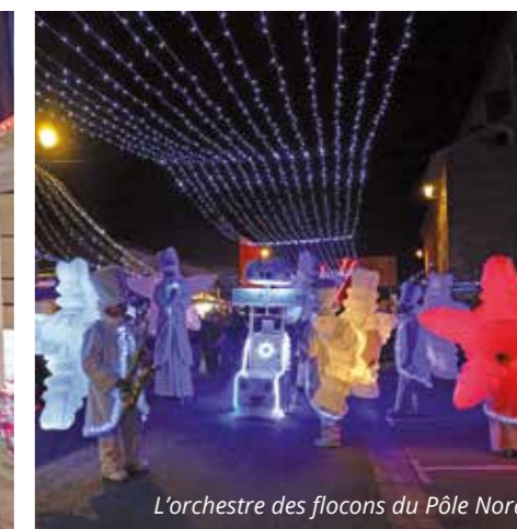
L'orchestre des flocons du Pôle Nord

La 20 e édition du marché de Noël a connu un magnifique succès le week-end du 3 au 5 décembre !