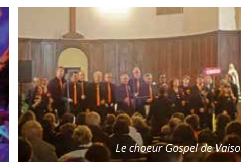
Le chœur Gospel de Vaison