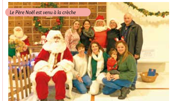
Le Père Noël est venu à la crèche