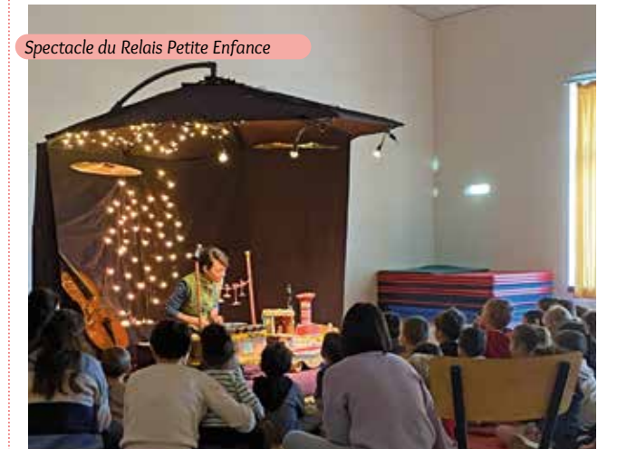
Spectacle du Relais Petite Enfance

Les différentes structures jeunesse de la commune ont tour à tour offert un spectacle de Noël aux enfants Althénois au mois de décembre.