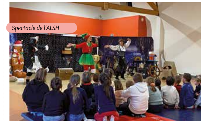
Spectacle de l'ALSH